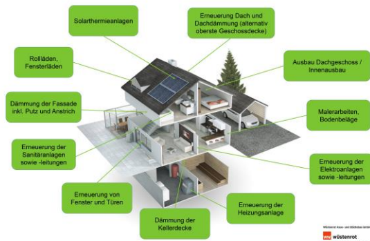
Förderfähige Modernisierungsmaßnahmen an privaten Gebäuden im Sanierungsgebiet