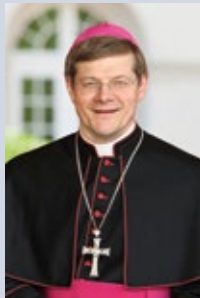
Stephan Burger Erzbischof der Erzdiözese Freiburg