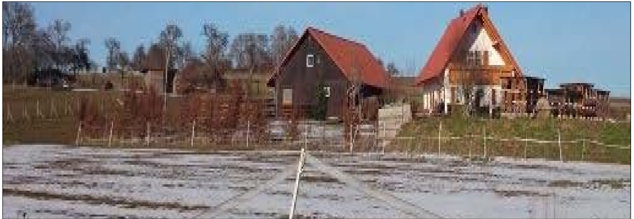
Abbildung 7: Blick von Südwesten über das Plangebiet

Das Grünland wird - wie auch die südwestlich angrenzende Umgebung - etwa zur Hälfte beweidet. Festgestellte Arten waren v. a. Schafgarbe, Weißes Labkraut, Goldhafer, Weißklee, Rotschwengel, Zier-Pippau, Scharfer Hahnenfuß, Glatthafer, Spitzwegerich, Mittlerer Wegerich, Gewöhnliche Braunelle, Löwenzahn, Knolliger Hahnenfuß, Rotklee, Knaulgras und randlich auch Wiesen-Salbei. Vorherrschend sind Grasarten und Schafgarbe. An lückigen Stellen wachsen Thymianblättriges Sandkraut und Wegwarte. Auch im Eingangsbereich des Stalles waren durch die intensive Beweidung entstandene Trittschäden ersichtlich. Die verbleibende Hälfte entfällt auf den rasenartig ausgebildeten Garten des Wohnhauses, welcher von einzelnen (Zier-) Sträuchern durchsetzt ist.