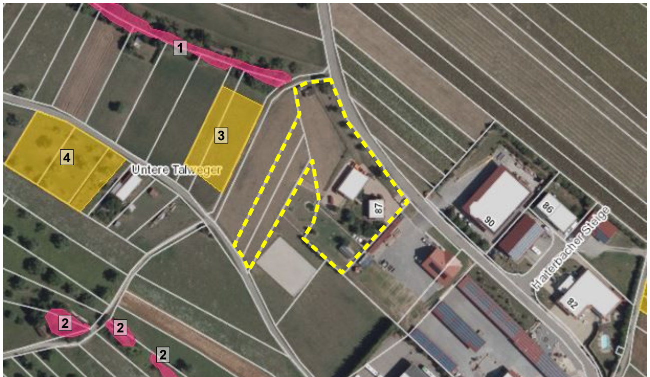
Abbildung 4: Detailansicht des auf ca. 585 m ü. NHN gelegenen Plangebiets (gelbe gestrichelte Linie = Skizze der Plangrenze). Das gesamte Plangebiet liegt im Naturpark Schwarzwald Mitte/Nord. Geschützte Biotope, Naturdenkmale oder ähnliches befinden sich nicht im Plangebiet. Die benachbarten geschützten Biotope und FFH-Mähwiesen sind durch pinke und gelbe Flächen gekennzeichnet: 1 = 2 Feldhecken mit Steinriegel NW Untertalheim, 'Hämmerlinsrain', 2 = 4 Steinriegel N Untertalheim, 'Untere Talweger', 3 = 'Mäßig artenreiche Salbei-Glatthaferwiese im Gewann Untere Talweger nördlich von Untertalheim', 4 = 'Mäßig artenreiche typische Glatthaferwiesen 1 im Gewann Obere Talweger'