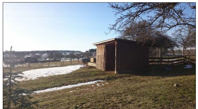
Abbildung 6: Holz-Offenstall

Neben dieser straßenbegleitenden Baumreihe befinden sich zwei kleine Hainbuchen-Hecken an der nördlichen bzw. südwestlichen Plangebietsgrenze (siehe Abbildung 5 und Abbildung 7).