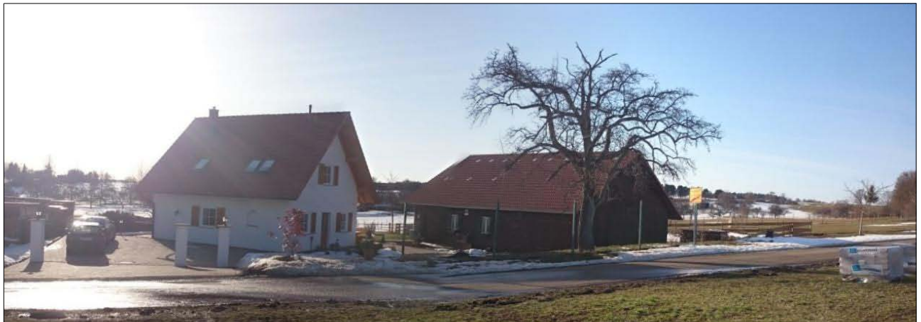
Abbildung 8: Blick auf das Wohnhaus und Nebengebäude aus Richtung Osten

Im Plangebiet befinden sich drei Gebäude (darunter ein kleiner Holz-Offenstall als Unterstand für die Weidetiere), befestigte Bereiche um die Gebäude und Rabatten (siehe Abbildung 6 und Abbildung 8).