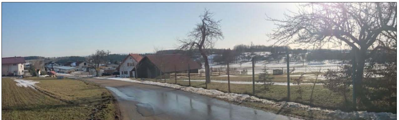
Abbildung 5: Blick auf das Untersuchungsgebiet von Norden aus

Der Gehölzbestand der sich entlang des nordöstlichen Rands des Plangebiets erstreckt, besteht aus insgesamt sieben Bäumen. Vertreten sind Obstbäume und Fichten ( Picea abies ) mit Stammdurchmessern auf Brusthöhe (BHD) von 7 cm bis 50 cm. In den beiden älteren Obstbäumen (BHD 30 cm und 50 cm) existieren vereinzelt Höhlungen an angebrochenen Ästen oder Faulstellen (siehe Abbildung 8).