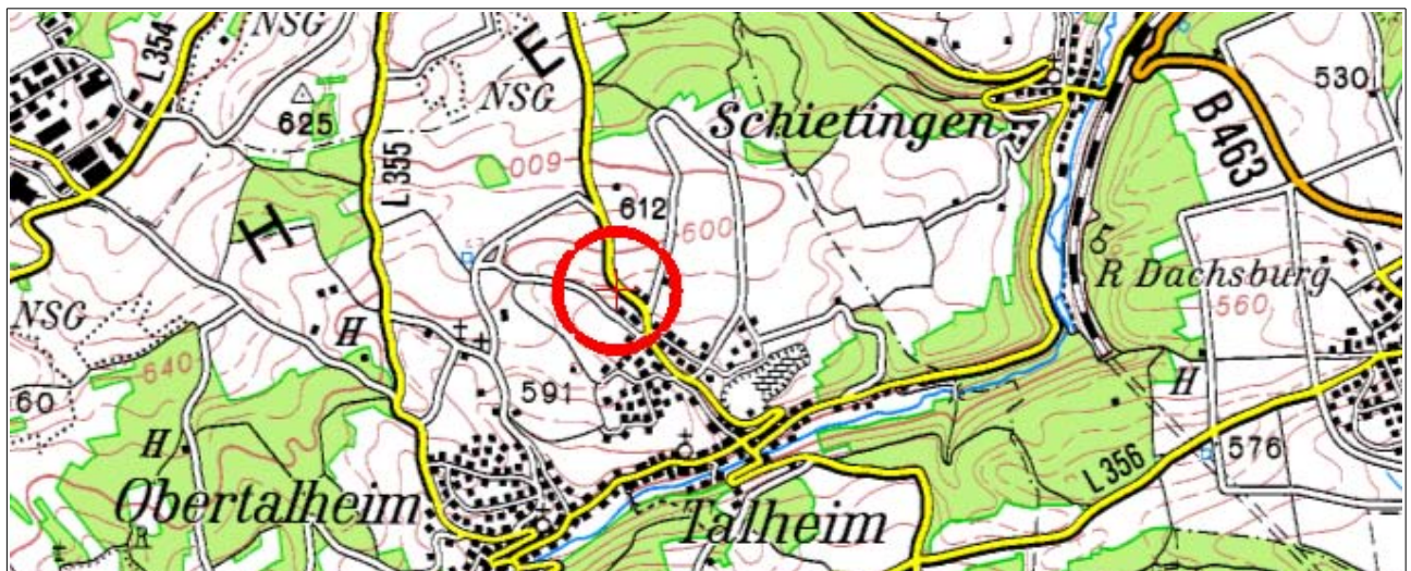
Abbildung 1: Übersichtskarte zur Lage des Plangebiets (rote Linie)

Das Plangebiet befindet sich am nördlichen Ortsrand von Talheim. Entlang der nordöstlichen Grenze verläuft die Haiterbacher Steige, während sich zu allen anderen Seiten (und auch hinter der Straße) landwirtschaftliche Nutzflächen anschließen. Im Bestand befinden sich neben Bebauung (zwei Gebäude und ein Stall) mit den entsprechenden Außenanlagen auch landwirtschaftliche Nutzflächen. Der Bebauungsplan wird aufgestellt um die Rechtsgrundlage für Neubauten südlich der bestehenden Gebäude zu schaffen. Gebäudeabbrüche, Baumfällungen oder Nutzungsänderungen sind aktuell nicht vorgesehen. Die nachfolgenden Ausführungen begründen sich auf dem aktuell geplanten Umfang des Eingriffes.