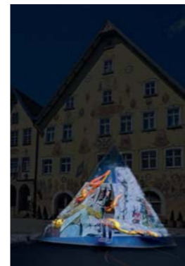
Konzept © Karla Kreh & Frank Fierke, Fotomontage © Frank Fierke